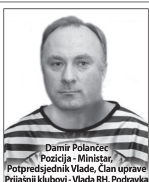
Damir Polančec Pozicija - Ministar, Potpredsjednik Vlade, Član uprave Prijašnji klubovi - Vlada RH, Podravka Vrijednost transfera - 10 milijuna kuna Prvi igrač koji je potpisao na dužu vjernost s NK Remetinec